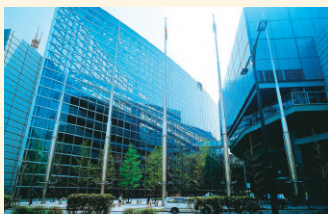
東京国際フォーラム外観

■ 地下鉄 有楽町線: 有楽町駅より徒歩 1 分 (B1F 地下コンコースにて連絡) 千代田線: 二重橋前駅より徒歩 5 分 / 日比谷駅より徒歩 7 分 丸ノ内線: 銀座駅より徒歩 5 分 銀座線: 銀座駅より徒歩 7 分 / 京橋駅より徒歩 7 分 三田線: 日比谷駅より徒歩 5 分